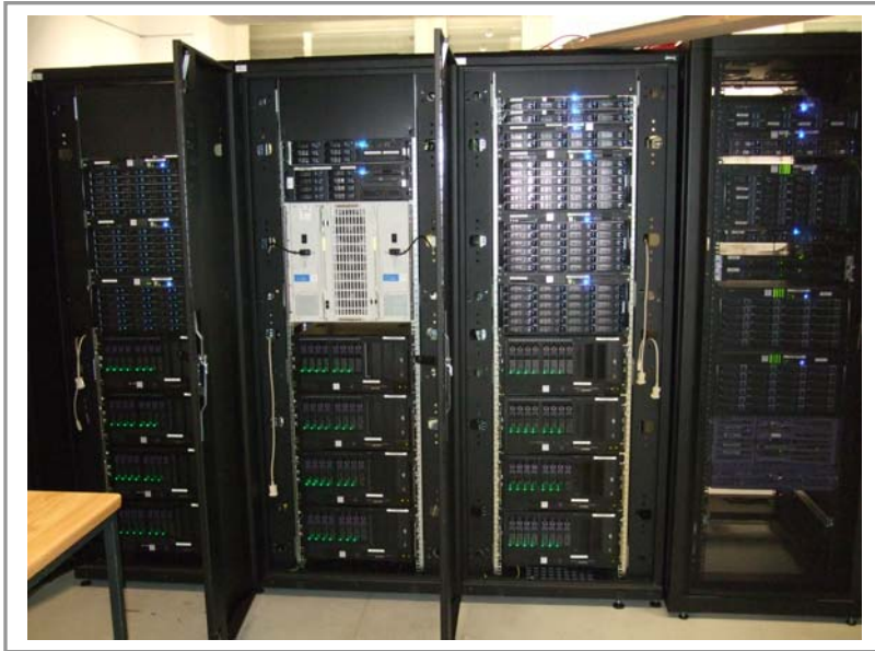
Clusteraufbau u. a. mit 8-way-Opteron-Nodes...